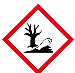
Schadelijk voor het milieu